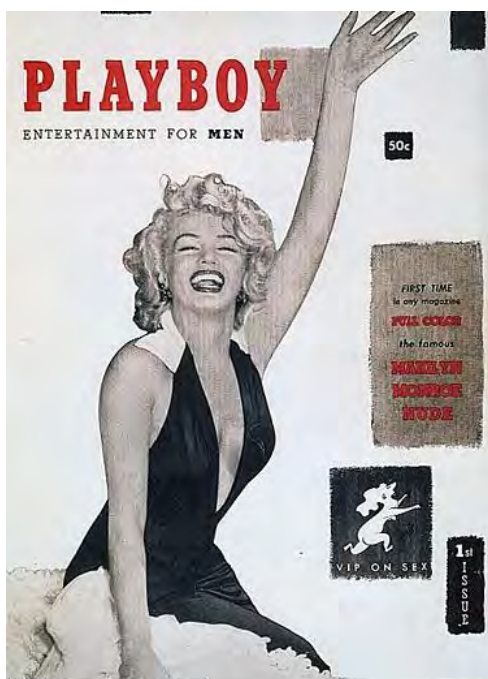
نخستین شماره مجله «پلی‌بوی» دسامبر ۱۹۵۳

چنین نگاهی به سرشت میل جنسی انسان از هر چیزی سخن می‌گوید جز گزارش‌های مربوط به